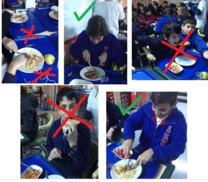
Yemek yerken çatal-bıçak kullanmaya özen gösterelim :)

“Hayatı öğreniyorum” programının da hedefi olan sofrada ahlak değerleri eğitimi konumuz kişilik sahibi olmakla bağdaştırıldı. Kişilik sahibi olan insanların aynı zamanda görgü kurallarına dikkat eden, sofrada ahlakına özen gösteren, davranış hal ve hareketlerinden sorumlu olan bireyler olduğu ifade edilerek tüm sınıflarımızla sofrada uyulması gereken görgü kuralları paylaşıldı ve konu ile ilgili videolar izlendi. Yemekhanede sofrada ahlak kurallarına uygun olan ve uygun olmayan davranışlar canlandırılarak fotoğraf çekilip afiş haline getirildi. Kişilik sahibi olmanın görgü kurallarına uymaktan ve özen göstermekten geçtiği ifade edildi.